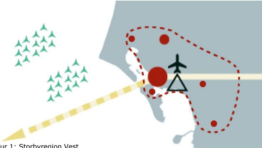
Figur 1: Storbyregion Vest

samarbejdet indgår i storbyregioner, men det gør Esbjerg ikke? Esbjerg er Danmarks EnergiMetropol og off shore centrum og er placeret i et område, hvor der, indenfor en radius af omkring 20 km, bor over 100.000 mennesker i bymæssige bebyggelser med Varde, Esbjerg, Bramming og Ribe som de væsentligste ankerpunkter. Job- og bosætningsområdet i storbyregion Vest er markeret på nedenstående kort.